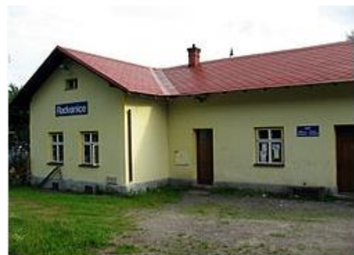
Radvanice, železniční stanice

Pivovar Krakonoš se nachází v centru města Trutnova. Od roku 1994 provozuje pivovar trutnovská Krakonoš spol. s r.o. V současné době vyrábí pivovar Krakonoš 5 druhů piva v celkovém objemu přes 100 tisíc hl ročně, na Vánoce a Velikonoce obohacuje trh o speciální světlé pivo Krakonoš 14. Pivo je distribuováno nejen do Východních Čech, ale i na Moravu. Pivovar Krakonoš vyrábí pivo klasickou technologií, nepasterizované, mikrobiálně filtrované. Pro výrobu piva je používána voda z vlastní studny, která je 80 metrů hluboká.